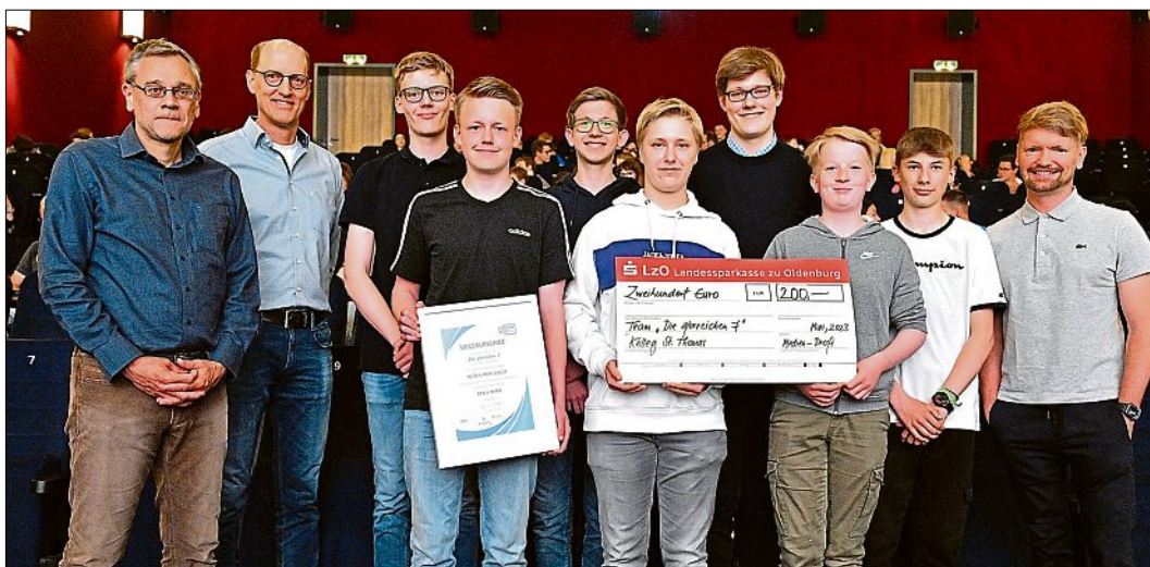
Den 4. Platz erreichte die Gruppe „Die_glorreichen_7“ des Kolleg St. Thomas.