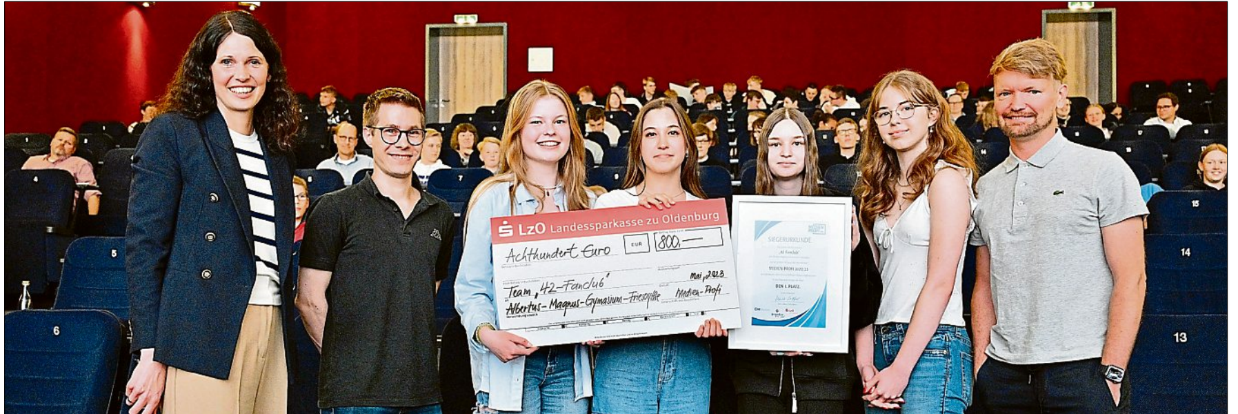
Das Gewinner-Team „42-Fanclub“ des Albertus-Magnus-Gymnasiums.

Den 2. Platz in dem Internet-Recherche-Spiel konnte sich das