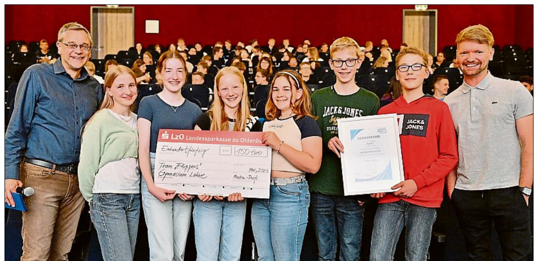
Den 5. Platz erreichte die Gruppe „Die Flippers“ vom Gymnasium Lohne.