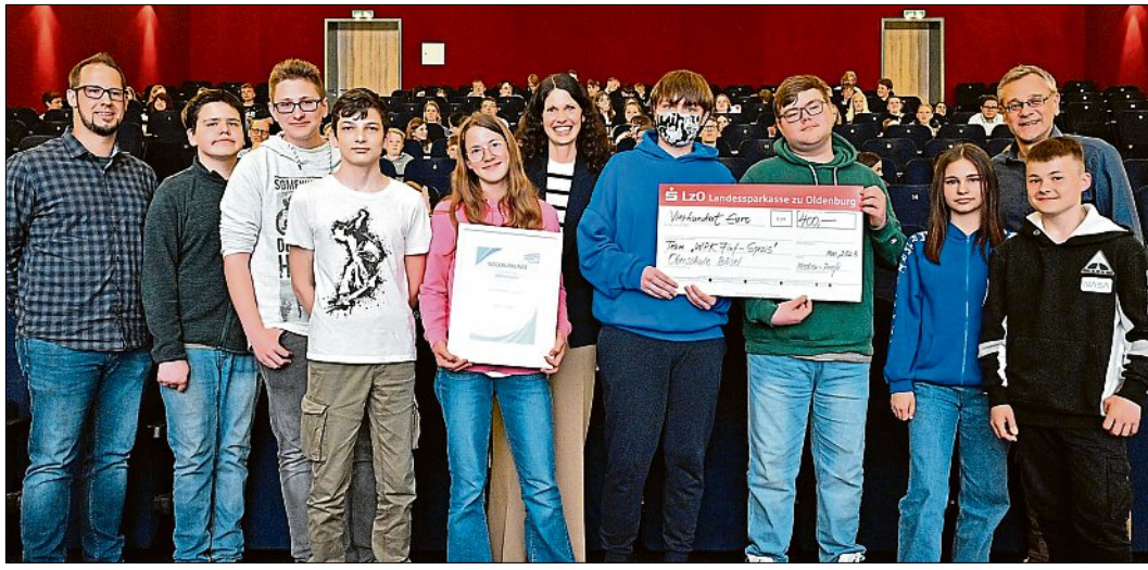
Den 2. Platz erreichte die Gruppe „WPK7Inf-Spezis“ der Oberschule Bösel.