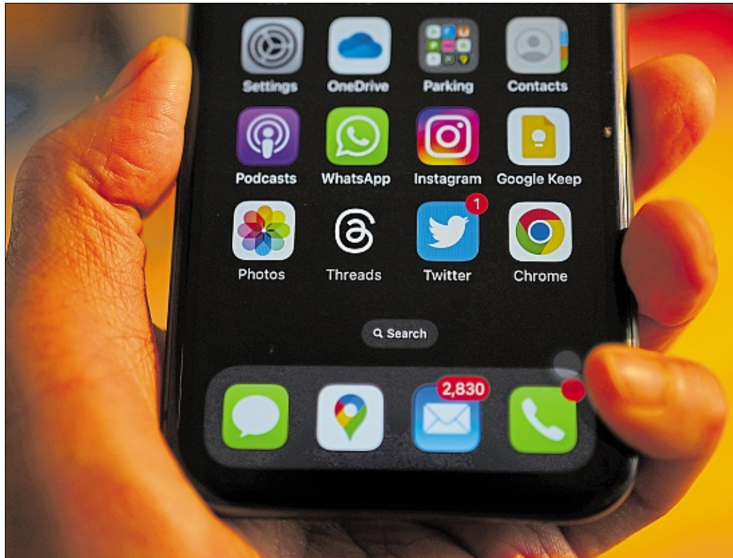
Chancen und Risiken von Social Media – darum ging es bei einem Vortrag an der Albert-Schweitzer-Realschule im Rahmen des Projektes „Medien-Profi“ der OM-Medien.

Zu Beginn der Veranstaltung im Rahmen des Projektes „Me-